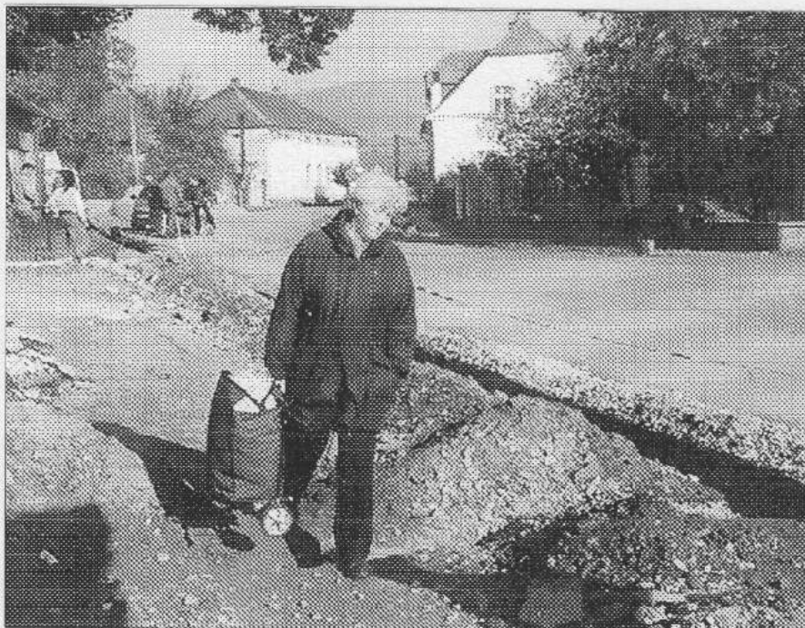
Pani překračuje poblíž zadno-třebaňské prodejny Jednota výkop, do něhož budou uloženy dráty. Budování nových telefonních rozvodů v naší obci je v plném proudu.