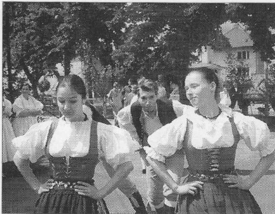
Naděšené ovace sklidl ve Třebani folklorní soubor Gaudeamus z Prahy, jenž u nás účinkoval o májích. Nyní k nám přijede opět - tentokrát s vánočním programem. (Viz str. 2)

Budovu nového moderního penzionu bude řevnická radnice splácet 10 let. „Jde o 9 milionů. Do konce roku ale chceme nahradit krátkodobou půjčkou, již jsme si během stavby vzali. výhodnějším hypotečním úvěrem,“ uzavírá řevnický první radní. (pš)