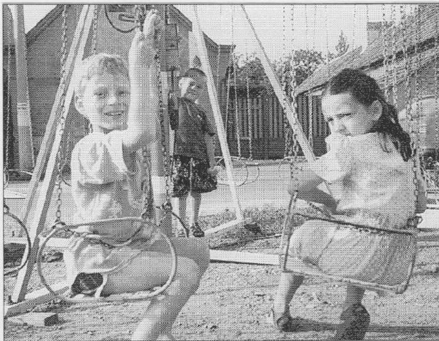
Velkou radost mají děti z hoapaček, kolotoče, střežnice a autodromu, které jsou jim k dispozici pod řevnickou poštou. Užívat si podle provozovatele atrakcí mohou ještě do konce měsíce.

„Lidé se v lese občas hlasitě svolávají, ale jinak problémy nemáme,“ potvrdil Roztočil s tím, že ani zakazy parkování nebyly zatím porušovány. Zato policisté upozorňují na množící se případy krádeží ve vozích odstavených u lesních cest. V katastrofu Revnic a Mníšku bylo jen o minulém víkendu vykradeno sedm aut. (Další informace na str. 5) (pš, vš)