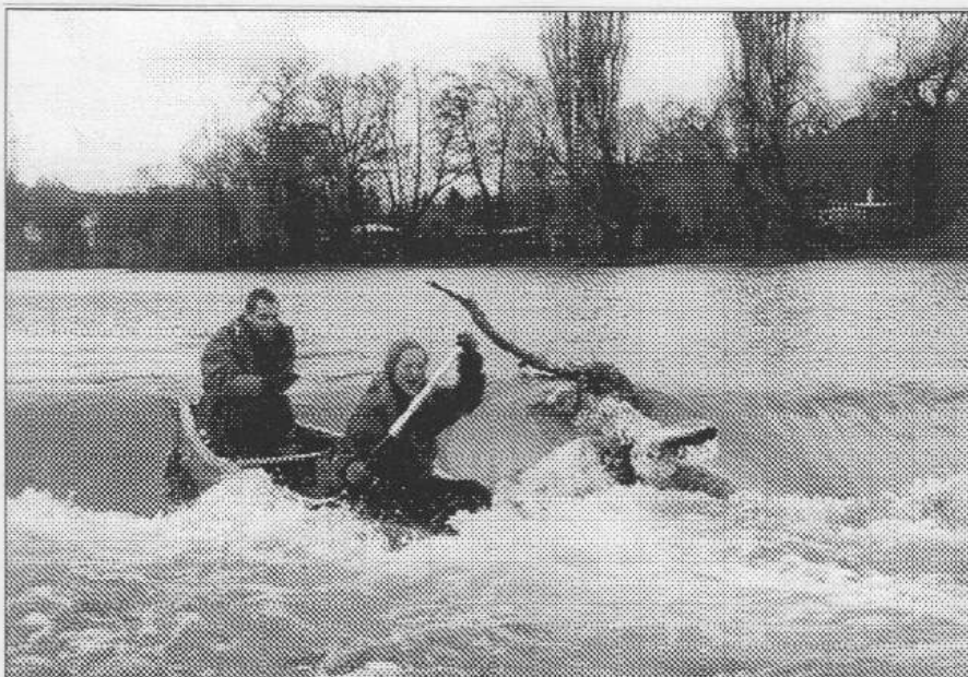
Odvážlivci sjížděli jez v Řevnicích. Nevele dvě desítky mediků se první prosincový víkend vydaly na lodích ze Srbska do Prahy. Zimní splouvání Berounky podnikly počtvrté.

dcer ani jedna nemá lovecké sklony po tatíkově. Já se snažil bezúspěšně o kluka, až mi to doktoři zakázali. Holky ale stále žebrały, že jim chybí bratr. V roce 1968 mi bylo osudem určeno získat tolik času, že jsem nevěděl co s ním; 3/4 roku jsem byl bez šance na zaměstnání a pracoval jako počítavač za 55 Kč denně. Vrhnu se na rybařinu. V roce 1970 po obdržení občanky jsem u podobných zaměstnání zůstal, a proto jsem si mohl dovolit se dále vzdělávat a stoupat na sportovním žebříčku až na přeborníka Prahy, trenéra a vedou-