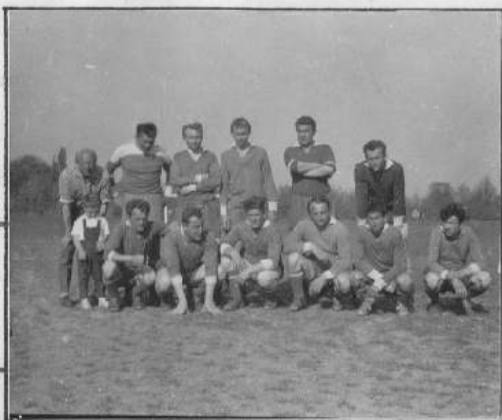
Květen 1964 - Litiěň

- v letech 1966 a 1972 se naši reprezentanti vydali za hranice. Cíl jejich cesty: Grössener v NDR. Schválně, kolik jich poznáte? / Foto z roku 1966. /