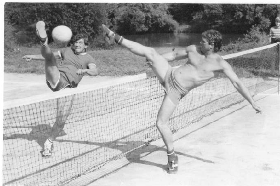
Turnaj v nehejbale - Zadní Třeban, ostrov - srpen 88