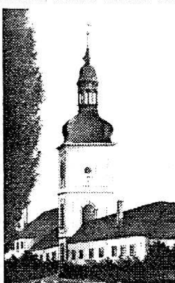
Obrázek bývalé věže vystavěné v roce 1717 a zbořené v roce 1864. Stávala v místech, kde je dnes zánek. Jedná se o zatím nejstarší zobrazení Osova, které se podařilo objevit. Kresba ARCHIV

blízkého okolí, o památkových místech a stavbách a také o osobnostech, které mají ke zdejšímu kraji vztah svým dílem nebo soukromým životem. Zdrojem informací mi vedle knih a časopisů byla především dvoudílná obecní kronika, občas noviny a nejnověji pak internet. Ráda bych touto cestou poděkovala také Vám všem, kteří jste mi vedle vyprávění o životě obce z dob Vašeho mládí často poskytovali i fotografie zachycující události z let dávno minulých, či dokumenty připomínající Osov v podobě dnes již neexistující. Velmi si vážím Vaši ochoty, se kterou jste tomu obětovali svůj čas, a doufám, že mi tímto nedocenitelným způsobem budete pomáhat i nadále, aby se podařilo znapovout místní