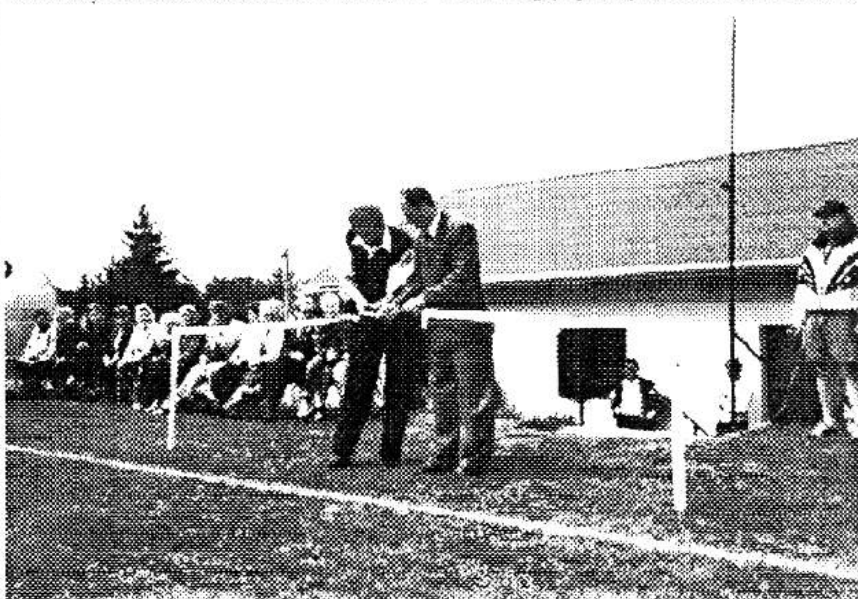
Slavnostním přestřihnutím pásky zahájil 29. července 2000 Fotbalový klub Vižina provoz svého nového hřiště.

V obci funguje prodejna se smíšeným zbožím,