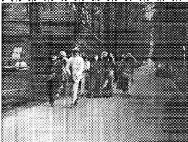
Osovský masopustní průvod v sedmdesátých letech na dobové foto grafii.

Je to období klidu před příchodem polních jarních prací a vrcholí již zmíněným masopustním úterkem, kdy se konají masopustní obchůzky - průvody maškár. Při těchto průvodech se vynášejí z vesnic a ze stavení smrtky, zimy a ukládají se do hrobtů, popř. se topí v řece. Maškary mají masky podle místních zvyků. Průvod většinou začíná tím, že vybrané maškary požádají starostu o povolení obchůzky. Následuje průvod obcí od domu k domu a maškaram je při obchůzce ledacens dovoleno a předem odpuštěno. Mohou vás např. pomazat sazemí, honit ve sněhu atd. Masky dostávají od hospodářů odměnu - dříve potraviny, vejčka, obilí, čnes i peníze. Zábava a hodování má končit o půlnoci, aby nebyl narušen šestitýdenní půst před velikonočními svátky.