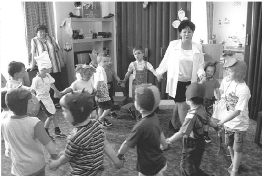
V mateřské škole ve Všeradicích pořádají pravidelně Vánoční posezení rodičů s dětmi, Jarní besídku a Slavnostní rozloučení s předškoláky. Děti si na tyto slavnosti připravují básně, tanečky, písně, ale také krátké dramatizace pohádek.