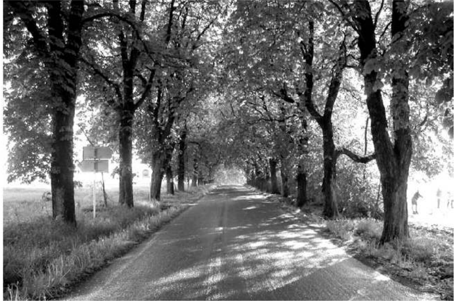
Majestátní kaštanové aleje mezi Osovem a Skříplí ohrožuje klíněnka. Původně lipové aleje byly začátkem 19. století nahrazeny kaštany. Bližší se snad doba jejich zániku?