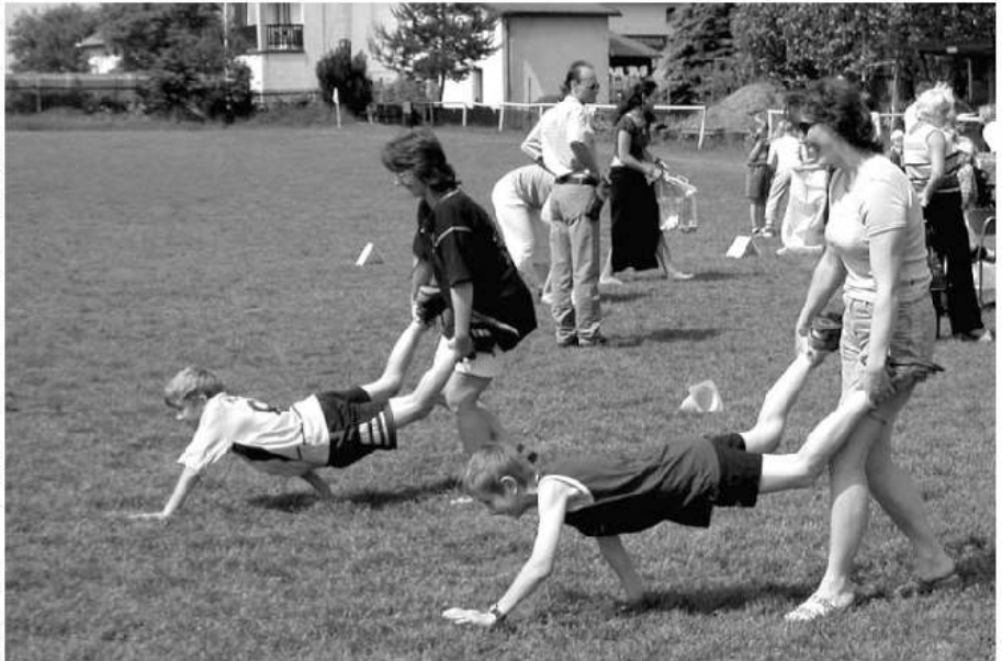
Parta nadšenců uspořádala první červnový den odpoledne pro děti na všeradicím hřišti. Jednou s disciplín byly i tradiční „trakaře“.