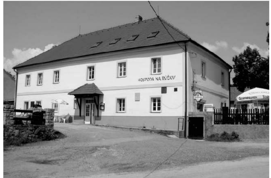
Ve Všeradické hospodě „Na růžku“ se můžete posíbit před další cestou po krásách podbrdského údolí.