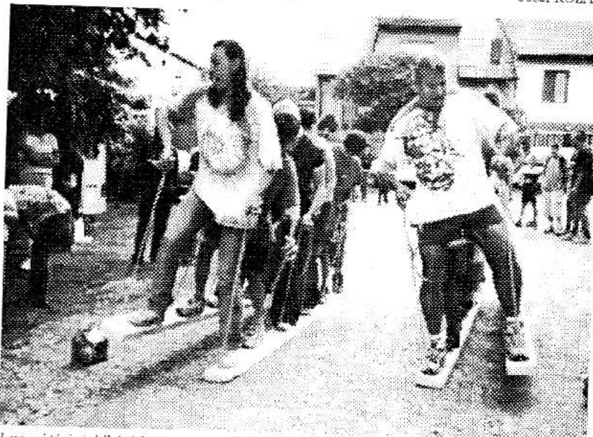
I na pátých jubilejních Letních slavnostech Leče byl největší zájem o „šlapací prkna“, na kterých museli soutěžící ujit určenou trasu.