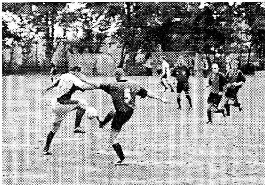
Dobrá hra osovských fotbalistů s Baníkem Mořina vedla nakonec k zaslouženému vítězství.