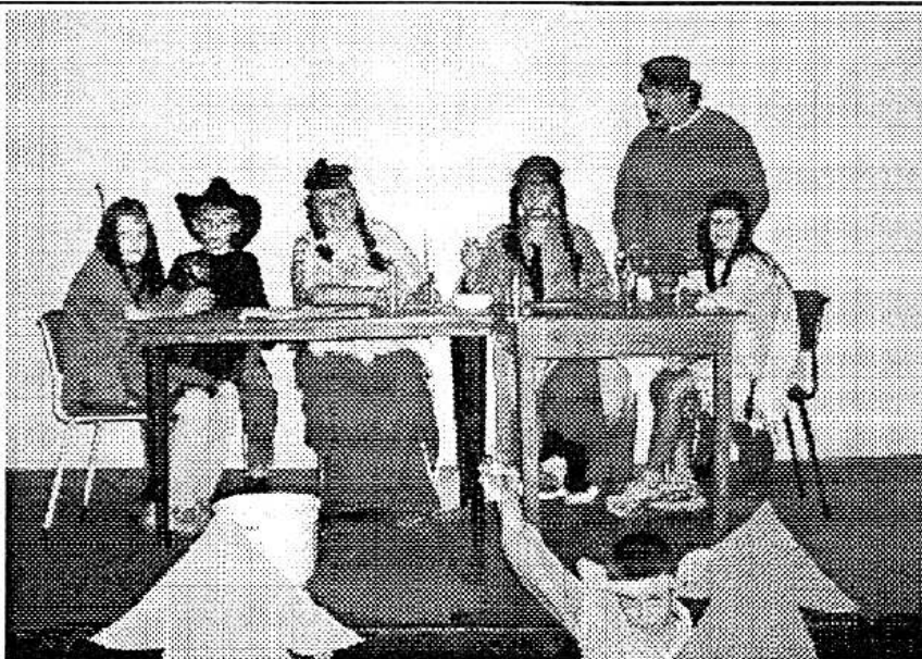
Scéna z ložské Babičky Mary, která možná odstartovala novou éru osovského ochotnického divadelnictví.