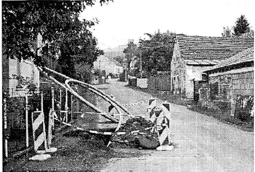
Posvícenskou nálaču ve Velkém Chlumu ruší výkopy budovaného vodovodu. Brzy by však měly silné modré trubky zmizet pod zemí a silnice bude opět volná.

Po Osovci oslaví tzv. „havčské posvícení“ 18. října Lážovice, 26. října Vižina a během podzimního svátku skončí o svátku zesnulých (dušičkách) ve Skříplí. Josef KOZÁK