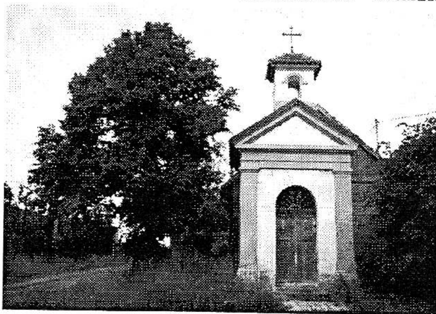
Kaplička, zasvěcená Panně Marii, tvoří spolu s rybníky a statkem jednu z hlavních dominant Nových Dvorů.