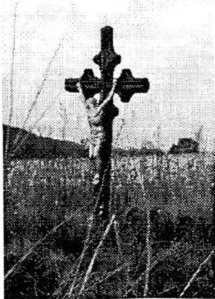
V polích při cestě z Lážovic do Skřiple stojí záhadný křížek. Dle pověsti zde byl zmařen lidský život. Však se tu také dodnes říká "Na Vrahu".

Velký Chlumec – Do finále se dostává výstavba místního vodovodu. Podle slov starosty Jaroslava Routy by měly být veškeré práce hotovy do konce října. A to i přesto, že kolaudace je plánována na příští rok. „Necháváme si rezervu“, říká chlumecký první radní. „V zimě těžko něco opravíme a tak bychom museli pokračovat až na jaře.“ Celá akce stála 10 milionů, z nichž 4,5 mohla obec uhradit ze státní dotace. Zbytek hraje ze svého rozpočtu a hlavně z našetřených peněz. (JoK)