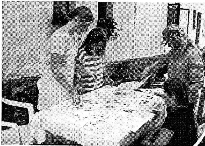
Každý měsíc pro vás připravuje kolektiv redakce občasníku PROVAS informační list z podbrdského údolí. Je třeba články napsat, zalámat, noviny vytyšknout a pak složit a roznést. Na snímku děvčata kompletují jedno z prázdninových čísel.

Svatý Václave, nedej zahynout nám ni budoucim