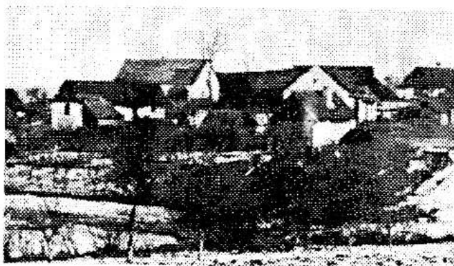
Nové Dvory na dobové fotografii z poloviny dvacátých let minulého století.