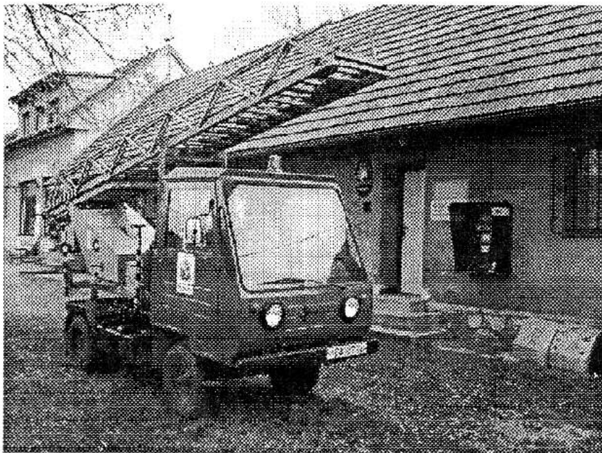
Požární žebřík stojí stále připraven před podbrdskou hasičárnou. Hned vedle sídlí obecní úřad a knihovna, na opačné straně pak prodejna se smíšeným zbožím.

Podle www.podbrdy.cz zpracoval Josef KOZÁK