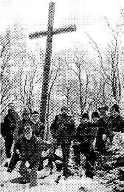
Turisté severních svahů Brd na Kuchyňce během tradičního novoročního výletu 1.1.2003.