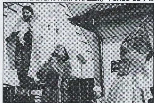
FRAŠKA NA NÁVSI. Masopustní hru na zadnotřebaňské návsi předvedli řevničtí ochotníci.