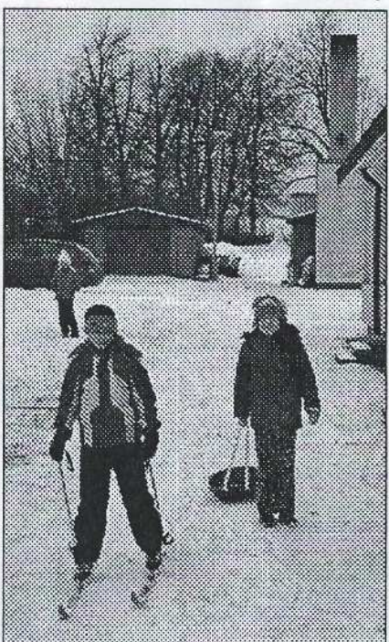
Čerstvě napadaný sníh vylákal jezdce na bobech i na běžkách.