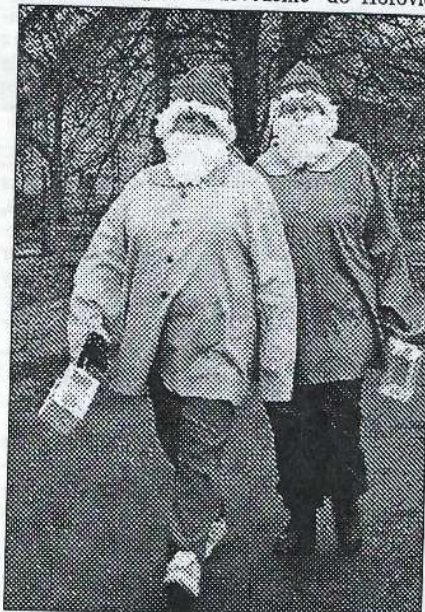
V osovském masopustním průvodu šlapali i dva nefalšovaní permontci.

V pondělí 14. února jelo 5 dětí z mateřské školy na soutěž „Co už dovedeme“ do Hořovic.