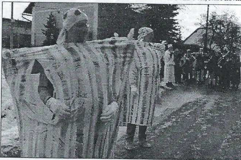
Bratři Procházkové v maskách peřin.

zpátky na sál po páté. Děti získaly sladké odměny za statečnost. Na zábavě vyhrávala Gamma. Pavla ŠVĚDOVÁ, Naše noviny