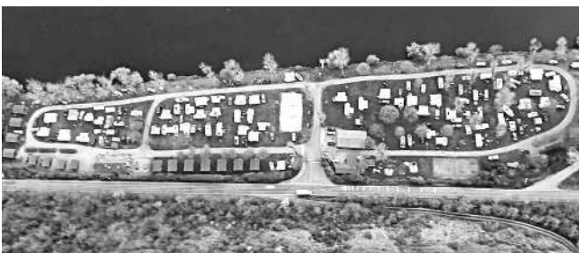
Karlštejnský kemp fotografovaný z koše balonu.

příznivé počasí a vysokou návštěvnost,“ uvedl jeho správce Jaromír Chvalina.