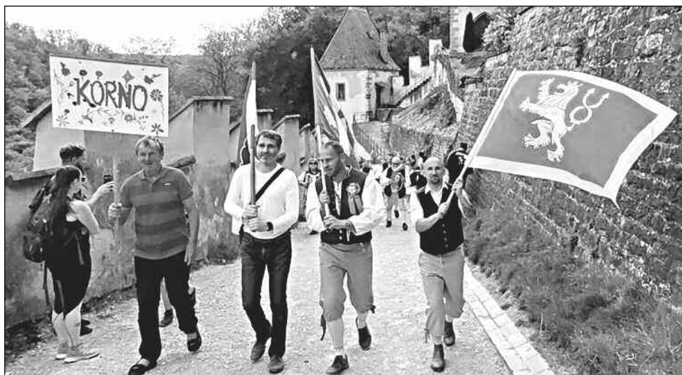
NA HRAD. V Karlštejně folklorní festival Staročeské máje začne průvodem na hrad.

Karlštejn. Neumětely. Beroun. Vinařice. Mníšek pod Brdy. Hlásná Třebaň. Mokropsy. Všeradice. Vižina. Zadní Třebaň. Tam všude se příznivci lidové muziky a tance mohou v květnu tohoto roku potkat s krojovanými soubory, cimbálůvkami, dudáckými kapelami, ale třeba i dechovkami nebo dětmi z místních škol a školek. Leckde se bude tančit česká či moravská beseda, leckde se půjde průvodem přes vesnici, leckde se bude žádat o právo, dražit a kácet májka. Na několika místech zavřít program večerní taneční zábava. Festival, nad kterým tradičně převzal záštitu místopředseda Senátu Jiří Oberfalzer, začne první májovou sobotu v Karlštejně. Slavnostní zahájení a část vystoupení se bude odbyvat přímo na nádvoří hradu, zbytek