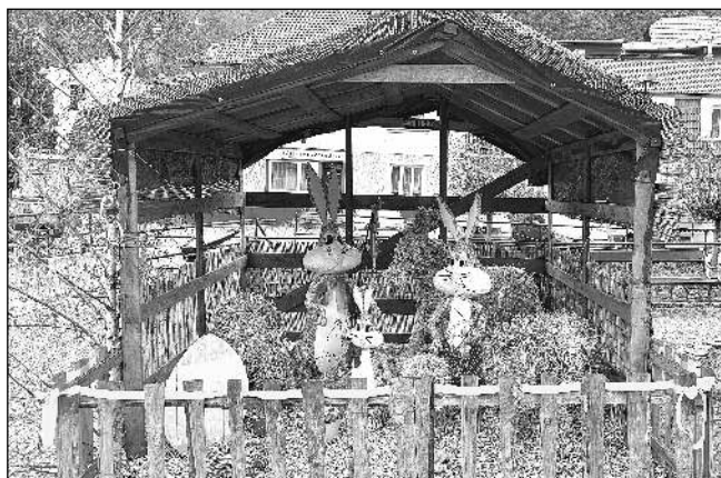
Betlém na karlštejském náměstí.