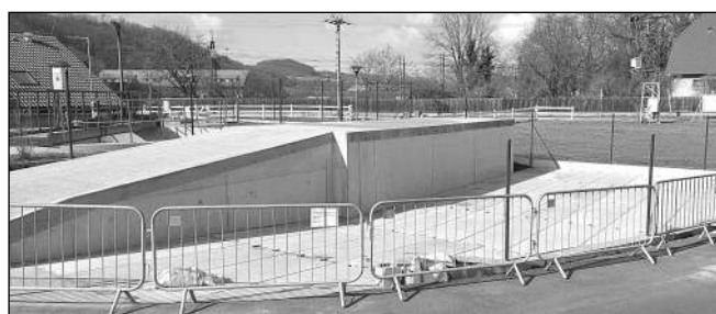
Nový sběrný dvůr u čistírny odpadních vod.

Výstavba chodníků a veřejného osvětlení od mostu k benzinové pumpě s příchodem jarního počasí - a blízkým se termínem dokončení - také výrazně zrychlila. V současné době prováděcí firma pokračuje s výstavbou z centrálního parkoviště směrem k čerpací stanici MOL. Na dokončené části zatím pokračují sadové úpravy a čeká se na osazení zábradlí