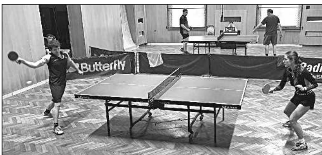
B-tým Karlštejna v zápase s Královým Dvorem.