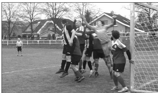
DEBAKL. V prvním jarním mistráku, dohrávce utkání z podzimu, podlehl zadnořebský Ostrovan v Hyskové 1:5.

Hosté nastoupili bez několika hráčů základní sestavy a na hřišti posledního týmu soutěže nedokázali bodovat. Jejich výkon postrádal nejen kvalitu v koncovce, ale i větší energii a důraz v rozhodujících momen-