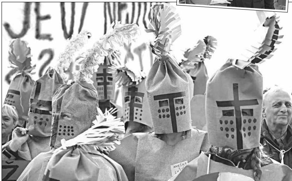
RYTÍŘI NA LETNÉ. Řevničtí Blaničtí rytíři demonstrující 21. března na pražské Letné.