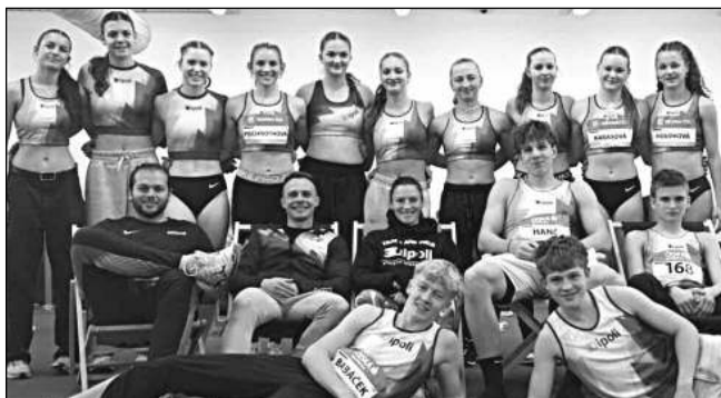
NA MISTROVSTVÍ. Úspěšná výprava ASK Dipoli na Mistrovství České republiky U18 a U20.