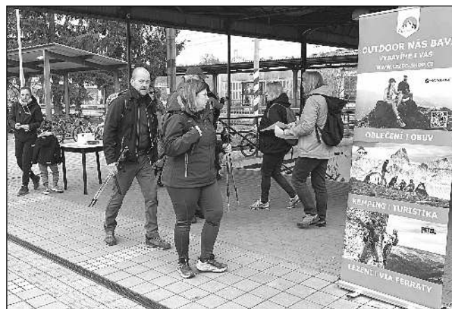
Účastníci pochodu na startu u řevnického nádraží.