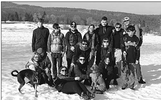
NA ŠUMAVĚ. Výprava ZUŠ Řevnice u Knížecích Plání.