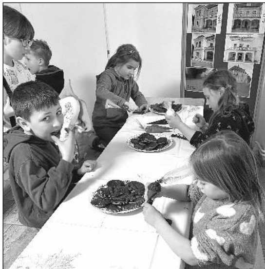
NA RADNICI. Děti při zdobení perníků a Morana, která vznikla při společném tvoření.

Zprávy z městyse i hradu, historie obce, kultura, sport... 2/2026 (178)