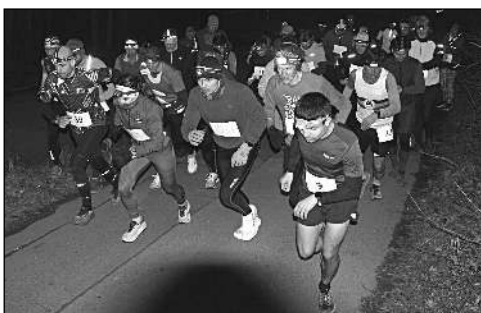
PO STARTU. Závodníci na trati.

V neděli 2. března se ve Všenoré konal další závod Běžecké série Berounka. I přes jarní prázdniny si na start našlo cestu čtyřicet běžců, kteří se nezalekli náročné tratě ani večerních podmínek.