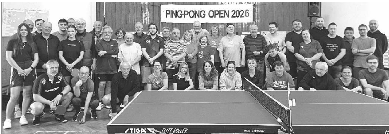
U STOLU. Účatníci turnaje ve stolním tenisu, který 14. března uspořádal zadnotřebský Klub českých turistů. (Viz strana 13)