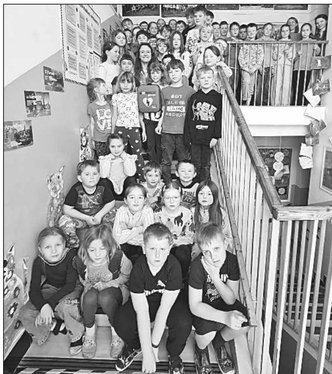
Třebeňští školáci s přenosným defibrilátorem.