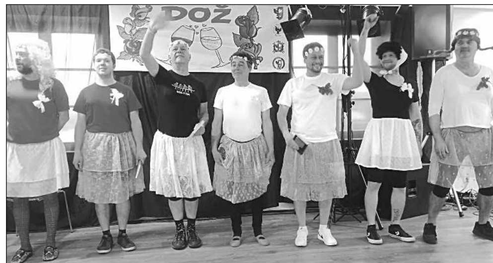
OCH NA DOŽ. Osovští chlapi (OCH) při svém vystoupení na Dnu osovských žen.

Po jarních prázdninách jsme si chtěli v osovské škole vyzkoušet některé olympijské disciplíny. Pro školáky byla uspořádána zimní olympiáda. Nechybělo slavnostní zahájení, ani