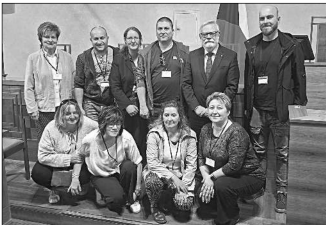
V SENÁTU. Zadnotřebaňští hasiči s místopředsedou Senátu Jirím Oberfalzerem (třetí zprava) při návštěvě horní komory parlamentu.

VE VALDŠTEJNSKÉM PALÁCI SE SETKALI S MÍSTPŘEDSEDOU HORNÍ KOMORY PARLAMENTU