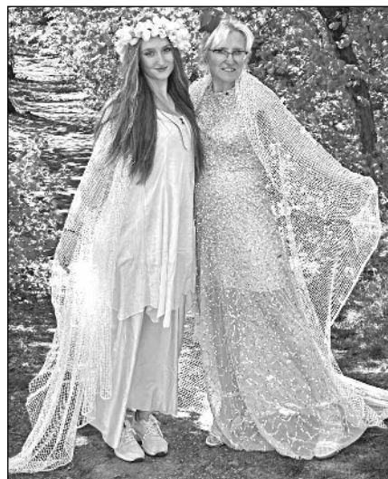
V POHÁDCE. Vily na trase Pohádkového lesa z Karlíka do Letů.

Ať už jste tu letos byli s námi, nebo jste to tentokrát nestihli, určitě neváhejte a vyražte příští rok - prvomájový Pohádkový les se bude konat již po šestnácté... Markéta HUPLÍKOVÁ, Lety