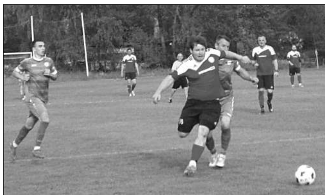
TĚSNÁ PROHRA. Zadnotřebský Ostrovan sahal v zápase s Trubínem po bodu, ale nakonec prohrál 3:4.