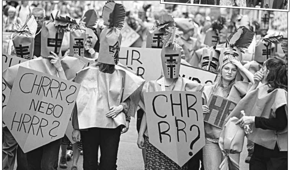
SMĚR ROZHLAS. (Nejen) řevničtí Blaničtí rytíři v průvodu z pražského Staroměstského náměstí k budově Českého rozhlasu, který se konal na protest proti snahám vlády zestátnit veřejnoprávní média.