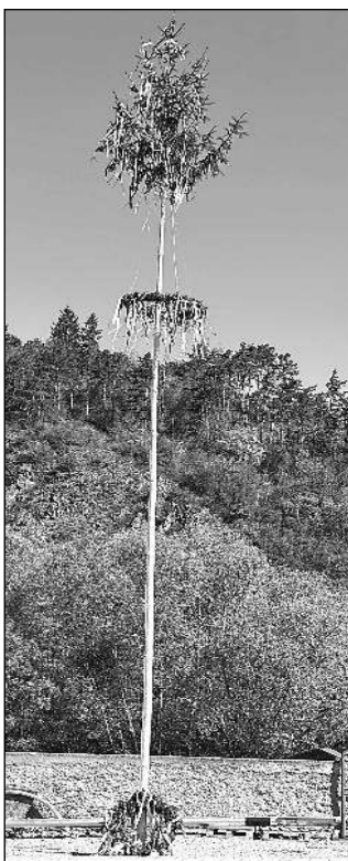
TROFEJ. Karlštejnská májka s ukoristěným hlásnotřebaňským věncem.