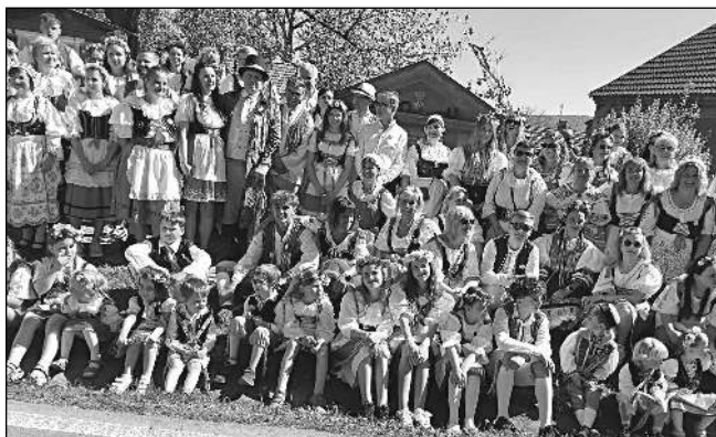
CHASA V KROJÍCH. Část krojovaných účastníků Staročeských májů, které se uskutečnily 2. května v Neuměteliích.

Zahájení mělo výjimečný ráz. Na vyzdobenou náves přiváhal vladyka Horymír na věrném koni Šemíkovi, aby akci symbolicky požehnal. Za ním přijelo koňské spřežení, které přivezlo pana starostu s chotí a obecní kronikářkou. Starosta následně předal právo Kecalovi, čímž tradiční májové oslavy oficiálně započaly. Poté se obcí vydal krojovaný průvod doprovázený dechovou hudbou Litavanka. Sousedé vítali průvod s otevřenou náručí i občerstvením, což přispělo k přátelské a radostné atmosfé-