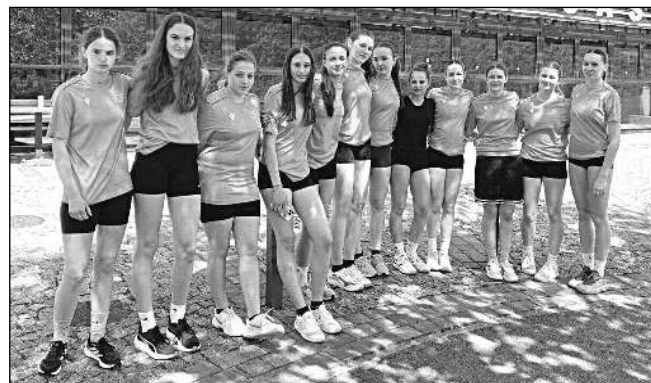
STŘÍBRNĚ. Reprezentantky řevnické školy, které vybojovaly stříbrné medaile na basketbalovém turnaji v Černošicích.

nic moc, ale i prohry ke sportu patří. Václava HROCHOVÁ, ZŠ Řevnice