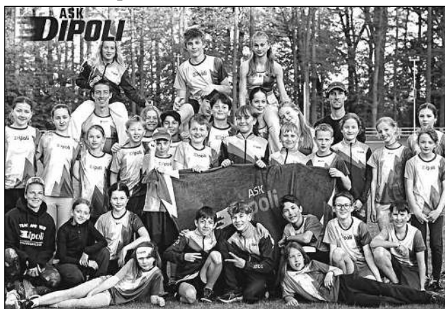
Mladší žáci a mladší žákyně ASK Dipoli.

Začaly letošní soutěže atletických družstev a týmy ASK Dipoli vstoupily do sezóny velmi úspěšně. Největší radost nám udělalo družstvo mladšího žactva, které po úvodním kole drží 1. místo. Juniorky jsou druhé, stejně jako dorostenky, dorostenkám patří místo třetí. Výborně si vedou také starší a mladší žákyně, které se po prvních závodech pohybují na postupových pozicích do dalších fází soutěže. Body sbíraly především díky vyrovnaným