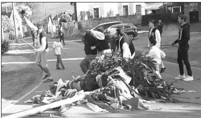
MÁJE. Poberounský folklorní festival se konal 9. května ve Vinařicích...