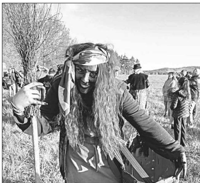
BABA JAGA. Vítězná účastnice letošního čarodějnického reje u hranice nad Osovem.

Čas pomalu plynul, plameny postupně dohasinaly, přesto poskytovaly dostatek tepla, neboť večer začal být velmi chladný. Děti odcházely domů a nahrazovali je noví příchozí, kteří se přišli pobavit a setkat se sousedy. Doutnající hranici hlídali po celou dobu obětaví hasiči ze zásaňové jednotky. Marie PLECITÁ, Osov