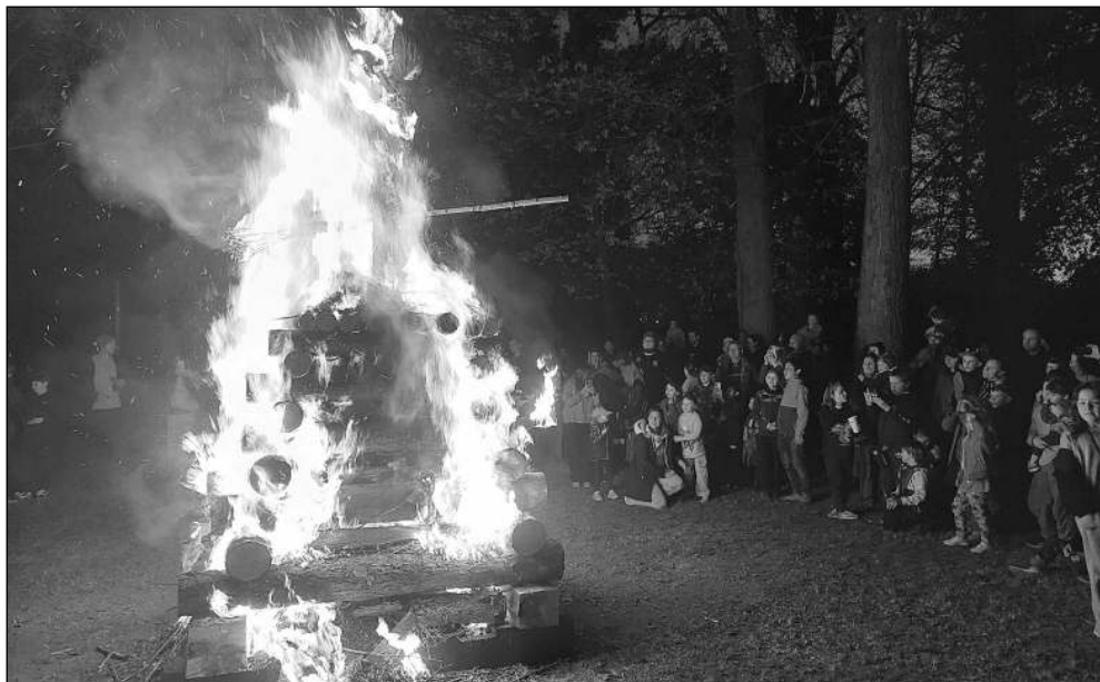
ČARODĚJNICE. Čarodějnická hranice v areálu karlštejnské hasičské zbrojnice.

Zprávy z městyse i hradu, historie obce, kultura, sport... 5/2026 (180)