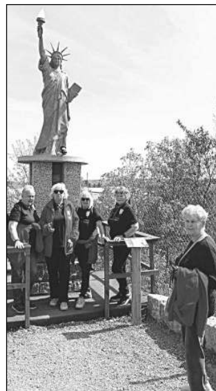
Hlásnotřebské Holky v rozpuku na výletě v Úžicích.