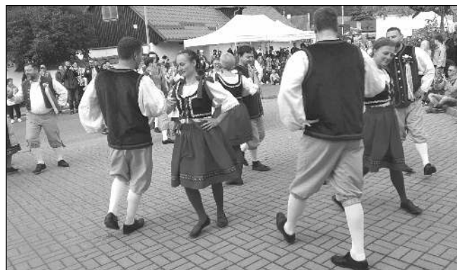
... a 16. května v Hlásné Třebani