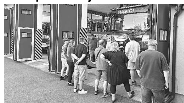
Den otevřených dveří Hasičského záchranného sboru (HZS) územního odboru Kladno se konal v neděli 3. května. Na stanici v Řevnicích jsme uvítali několik desítek dětí i dospělých, kteří se zajímali o činnost jednotky. Hasiči předvedli zájemcům zásahovou techniku, prostory hasičské základny a zodpověděli dotazy týkající se zásahů i práce záchrannářů.